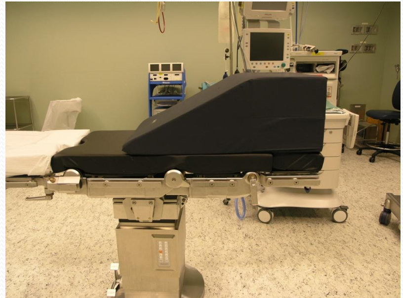
Over 120 kg