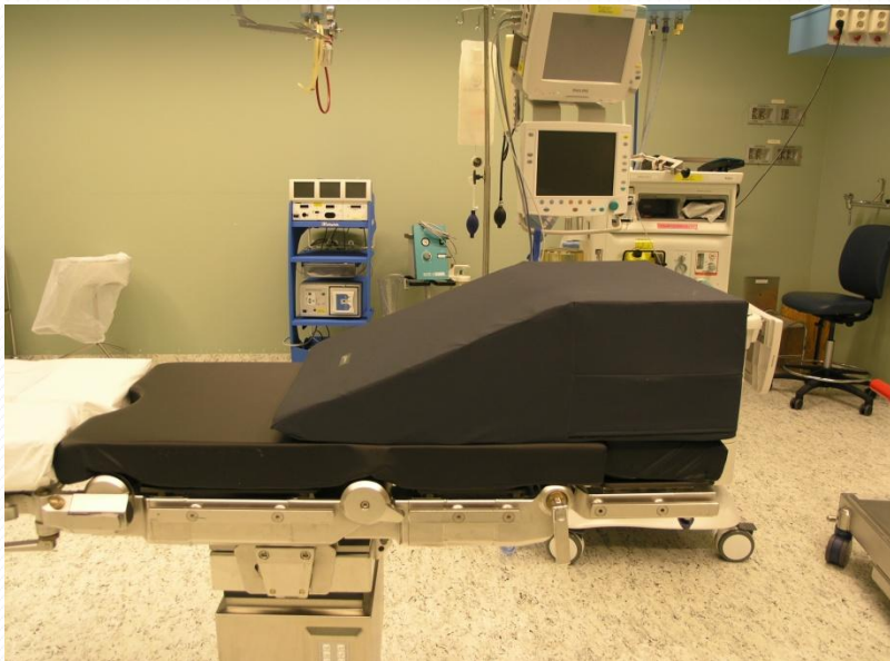
Under 120 kg