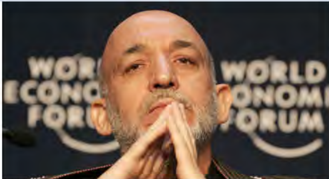
STYRER 30 PROSENT: Han er Afghanistans president. Men kontrollen over hans eget land begrenser seg til under en tredel av landområdet.